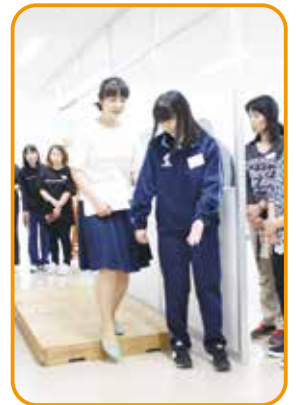
▲前回の講座の様子

福井市社会福祉協議会ボランティアセンター (田原1丁目13-6 フェニックス・プラザ1階) TEL 22-0022 FAX 26-9109 Eメール mag@fukuic-shakyo.jp