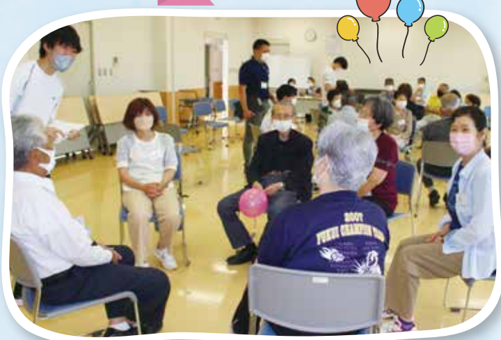
▲ゲーム終了後は、参加者の感想や意見に耳を傾けました