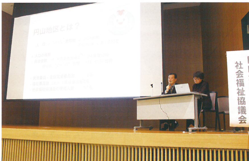
発表者の河合・野村両副会長（円山地区社協）

このように、各地区や他の団体の活動内容を共有することが、より良い取組みの実践につながります。ぜひ積極的に情報交換することをおすすめします。