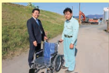
三協道路株式会社様