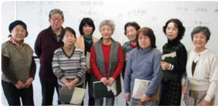
朗読友の会の皆さん

点訳版や音訳版の社協だよりのご利用を希望されるご本人からのお問い合わせはもちろんのこと、ご家族やお知り合いの方等で希望される方のお心当たりがございましたら、是非お気軽に福井市社協までお尋ねください。