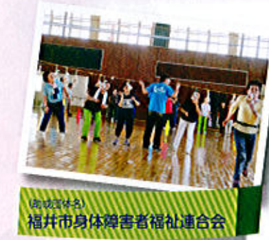
福井市身体障害者福祉連合会