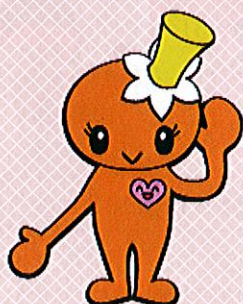
サッカーゲーム(とまと児童館)