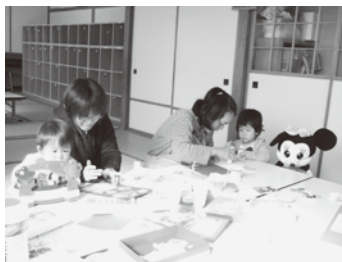
～子育てひろばの様子～ さつき児童館(旭)

※祝日、学校の長期休業中はお休みです。また、その他各児童館の都合で休みになる場合がありますので、最寄りの児童館、または市社協へお問い合わせ下さい。