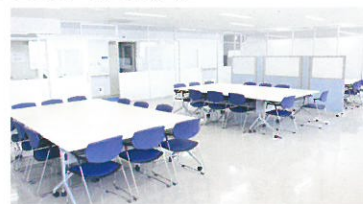
ボランティアルームA

※登録申請書は、福井市社会福祉協議会ボランティアセンターのホームページからダウンロードできます。