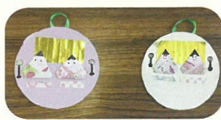
▲おひなさまのカード