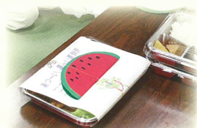
▲夏を感じるすいかのメッセージカードを添えました(7月)