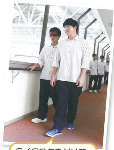
アイマスクを付けてガイドヘルプを体験