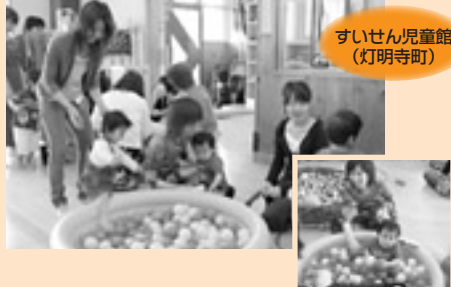
すいせん児童館 (灯明寺町)