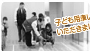
▲3月26日、福井中央ライオンズクラブから子どもたちの福祉体験に役立ててほしいと車いす2台をいただきました。まつのき児童館で贈呈式が開催された後、子どもたちが車いすの体験をしました。