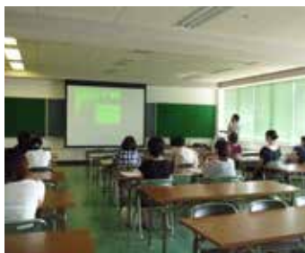
前回の福祉教育サポーター養成講座の様子