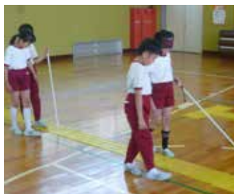
小学校での福祉体験学習の様子