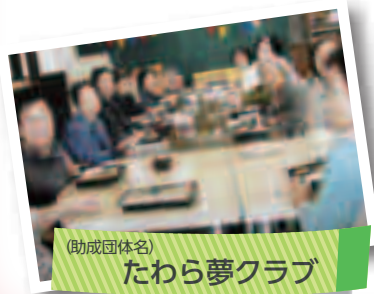
(助成団体名) たわら夢クラブ

この事業では、食事や世間話を通して楽しく過ごす機会をつくることで、高齢者の仲間づくりを支援しています。高齢者の皆さんに集まってもらい、一緒に季節に合った料理を食べたり、ボランティアによるコンサートや健康に関する勉強会を行うなど、楽しみに参加していただけるよう企画を考えています。おかげで、外出や仲間と集う機会が少ないうち暮らし高齢者の方にとっての集いの場が、健康維持にも役立つと、とても喜んでいただけてました。本当にありがとうございました。高齢者の仲間づくりのため、これからも応援をよろしくお願いいたします。