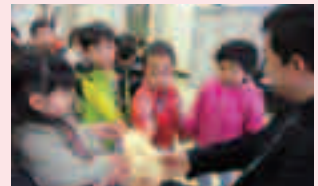
報徳幼稚園の園児の皆さんが募金を届けてくれました。