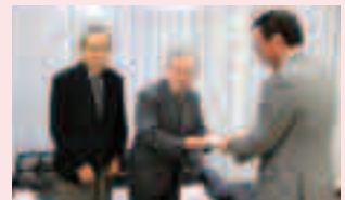
明るい社会づくり推進協議会様(左)から、今年も募金をいただきました。