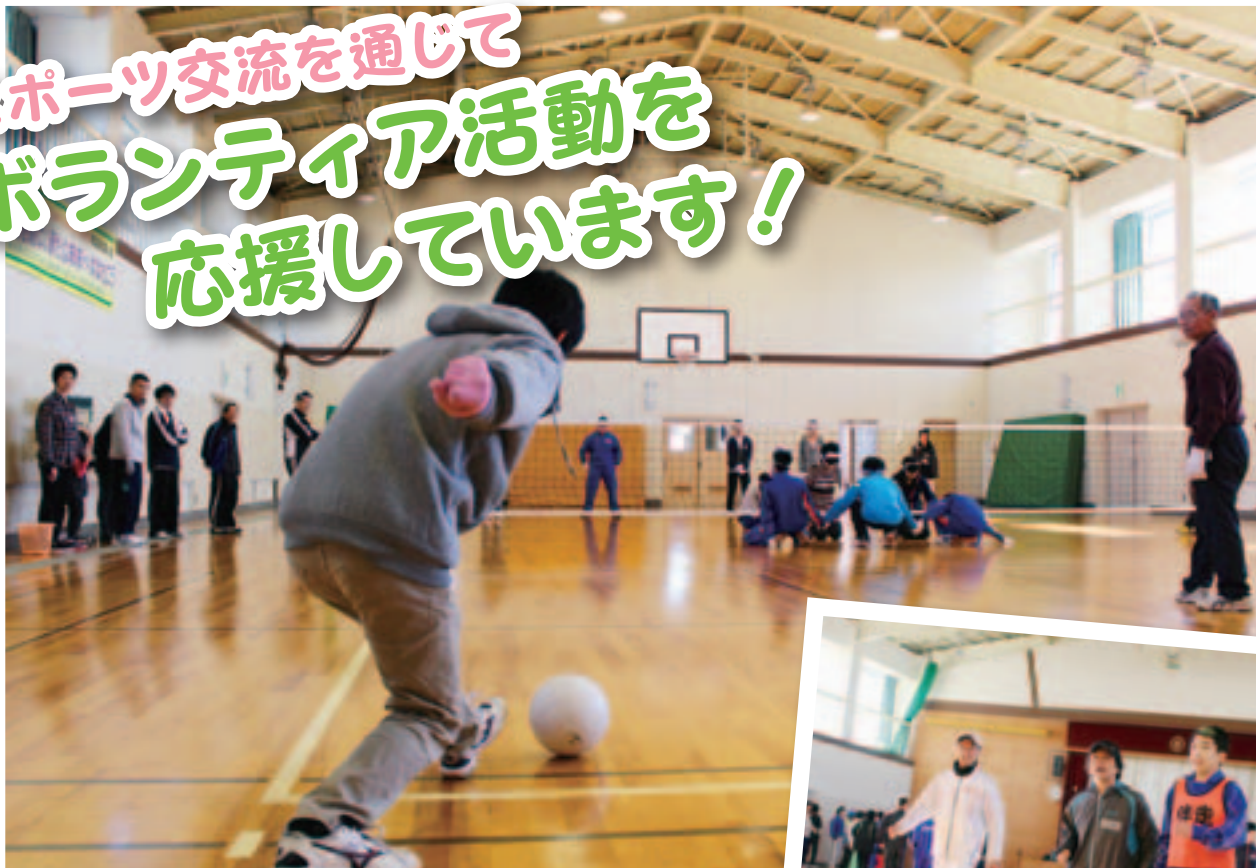
フロアバレーボール体験