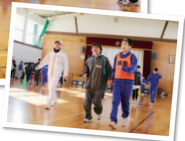
マラソンの伴走体験