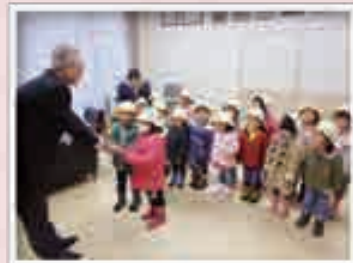
報徳幼稚園の園児のみなさんが募金を届けてくださいました♪