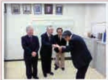
毎年街頭募金にご協力いただいている明るい社会づくり推進協議会の皆さまです。募金活動ありがとうございました！